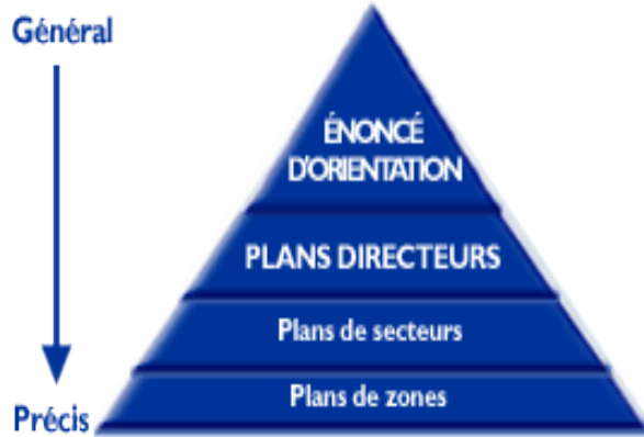
Figure 1 - Le cadre de planification

CCN a la responsabilité d'élaborer. Le graphique et les explications ci-dessous présentent cette série de plans. Les plans de secteur se situent au troisième niveau hiérarchique