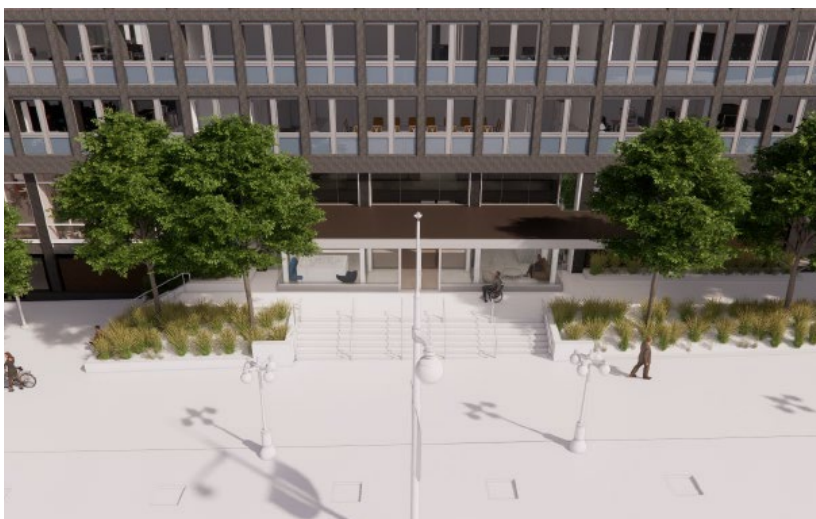
Entrée principale du 80, rue Elgin.