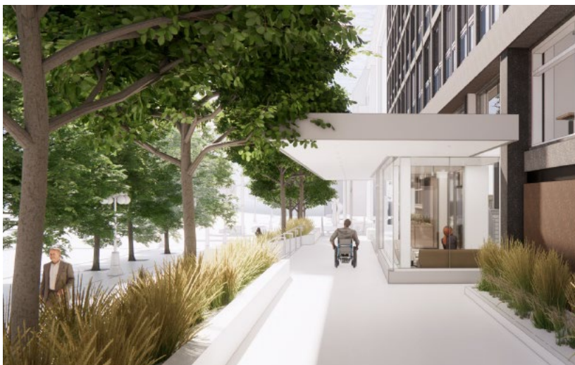
Vue latérale de l'entrée du 80, rue Elgin, illustrant l'utilisation de la rampe d'accès pour fauteuils roulants.