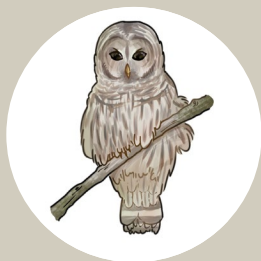
Barred Owl Chouette rayée

Les espèces les plus susceptibles d'être observées dans la tourbière Mer Bleue