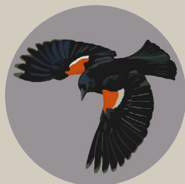
Red-winged Blackbird Carouge à épaulettes