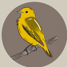
Yellow warbler Paruline jaune