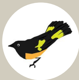
American Redstart Paruline flamboyante