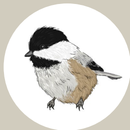
Black-capped Chickadee Mésange à tête noire