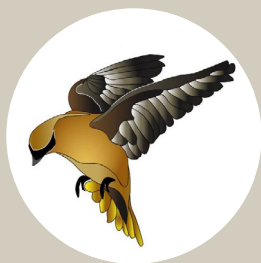
Cedar waxwing Jaseur d'Amérique